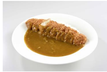
《『真健鶏』チキンカツカレー 850円》