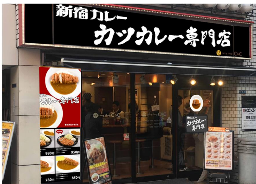
《 新宿カレー 西新宿1丁目店 イメージ》

当社では今後もカレーショップC&Cブランドを積極的に展開し、店舗網拡大を図ります。詳細は下記のとおりです。