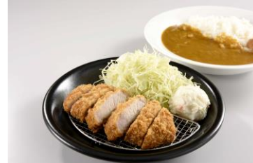
《イベリコ豚ロースカツカレー 980円》