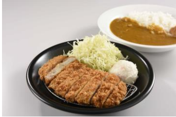
《熟成三元豚ロースカツカレー 900円》