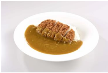
《特撰ロースカツカレー 780円》